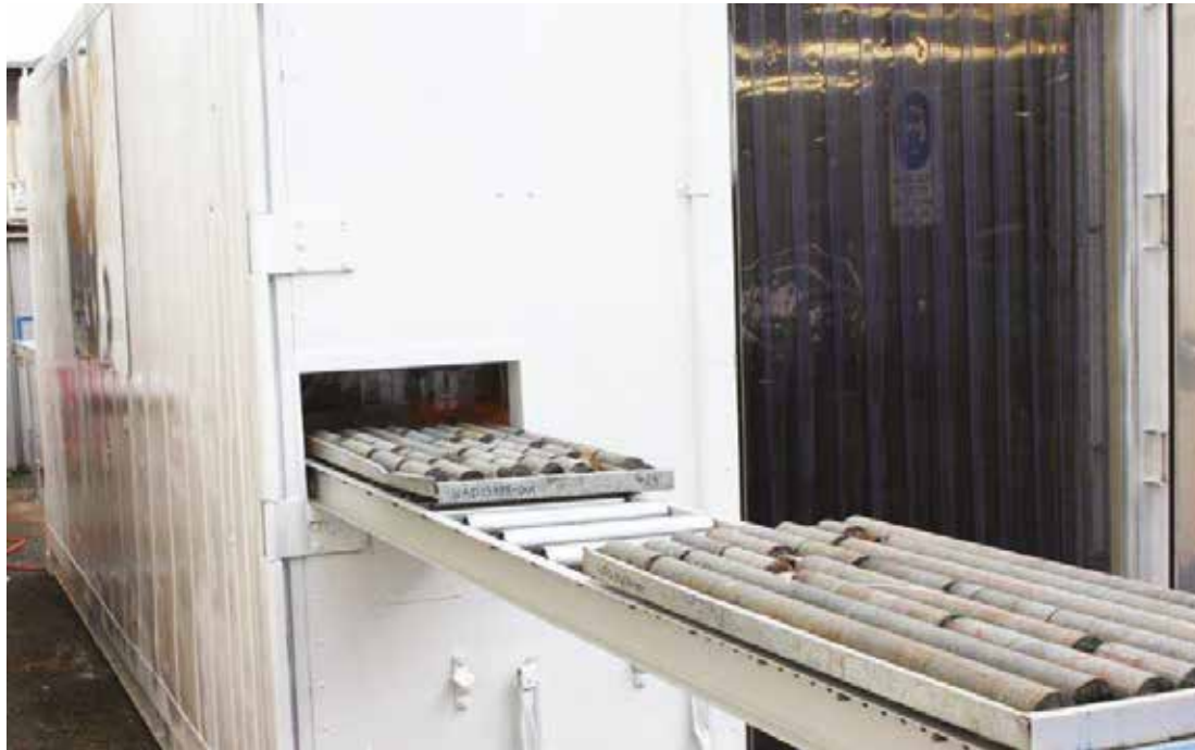
Contenedor de Cortadora de Testigo